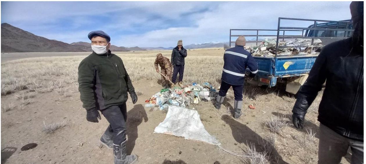
Цагааннуур тосгонд 3 байгууллагын 20 хүн оролцож 7 тонн хог цэвэрлэв.