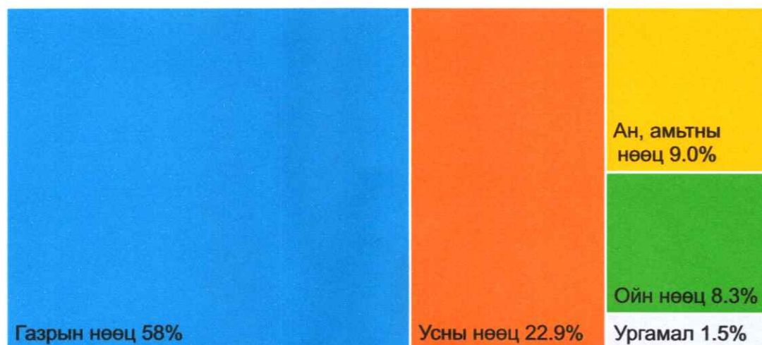
График 1. Байгалийн нөөцийн 5 төрлийн орлогын гүйцэтгэлд эзлэх хувь

Байгалийн нөөц ашигласны төлбөрийн 2022 оны орлого 223.8 тэрбум төгрөг болж 2021 оноос 73.9 тэрбум төгрөг, 2020 оноос 111.7 тэрбум төгрөгөөр өссөн нь газрын төлбөрийн орлогын өсөлтөөс шууд хамаарч байна (Хүснэгт 3).