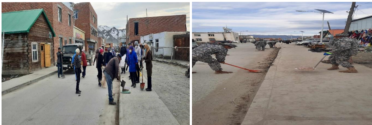
БАЯН-ӨЛГИЙ АЙМГИЙН БАЙГАЛЬ ОРЧИН, АЯЛАЛ ЖУУЛЧЛАЛЫН ГАЗАР

Байгаль орчин аялал жуулчлалын сайдын 08-р албан даалгавар болон Байгаль орчин аялал жуулчлалын газрын даргын 2023 оны 9-р сарын 04-ний өдрийн 275 тоот үүрэг даалгварыг биелүүлэх зорилгоор 2023 оны 10 сарын 13 ны өдөр сумын засаг даргын А/137 захирамжийн дагуу нийт 12 байгууллагын 120 гаруй албан хаагч нар сумын төвийн 3 км орчим гудамжинд эзэнгүй 3тн хог, Харгантын гол, Ховд голын эрэг, Байтас рашааны орчимын нийт 2 тн гаруй эзэнгүй ил задгай хаягдсан хогийг цэвэрлэж, гарсан хогийг сумын нэгдсэн хогийн цэгт хүргэж ажиллав.